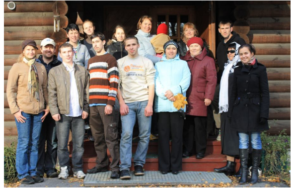
Seminár - školenie pre pracovníkov s deťmi a mládežou v cirkevnom zbore Jukki

Robím tak s vedomím, že misia našej ECAV na Slovensku bez vašej podpory a modlitieb nie je možná.